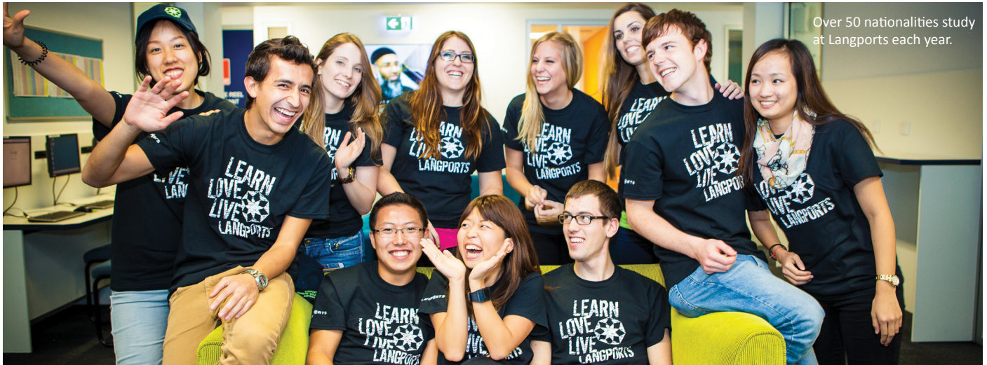
Over 50 nationalities study at Langports each year.